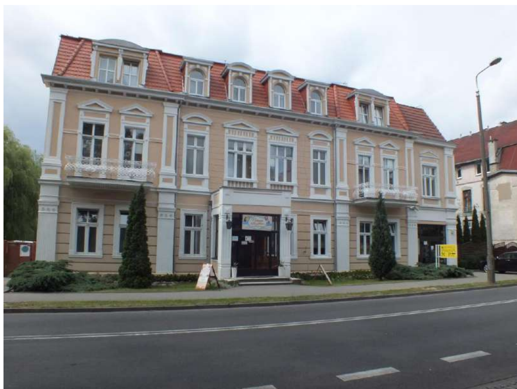
2018 r. budynek odrestaurowany przy wsparciu miasta