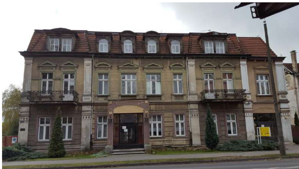
2017 r. budynek przed pracami konserwatorskimi

Budynek wzniesiony na przełomie XIX/XX w. użytkowany, jako dom mieszkalny i hotel. W fasadzie frontowej zachował formy historyzujące, nawiązujące do klasycyzmu. Frontową elewację budynku ozdabiają m.in. ryzality, pilastry, gzymsy, fryzy, bonie, płyciny podokienne imitujące balustradki oraz kute balkony w formie koszy. Budynek został odrestaurowany w 2018 r. przy wsparciu dotacją z miasta .